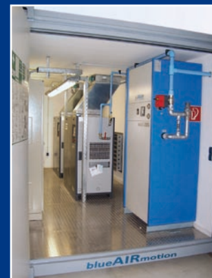
Dezentrale Kompressorstation gestern (links) und heute (rechts)