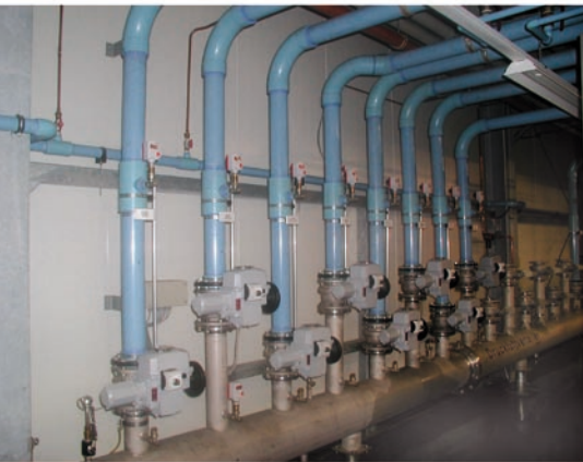
Modernes Druckluftnetz als blueAIRmotion-System mit Flowmeter und spaltloser Rohrverbindung in der Praxis

gibt sich die Frage nach Haftungen und Re- gessen.